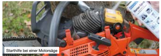
Starthilfe bei einer Motorsäge