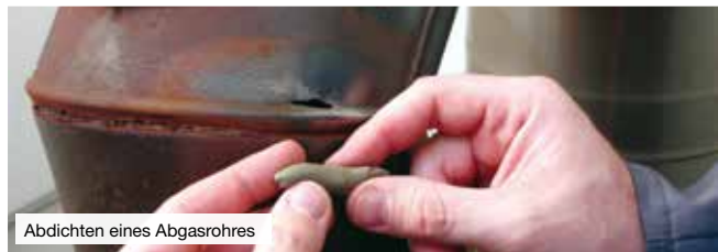
Abdichten eines Abgasrohres