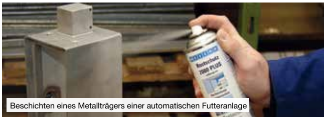
Beschichten eines Metallträgers einer automatischen Futteranlage