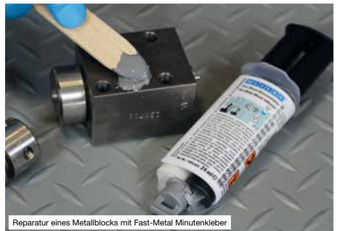
Reparatur eines Metallblocks mit Fast-Metal Minutenkleber