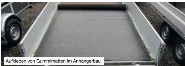
Aufkleben von Gummimatten im Anhängerbau

GMK 2410 ist ein Klebstoff auf Basis von Polychloropren (CR) mit einer hohen Anfangshaftung zur vollflächigen und flexiblen Verklebung von: