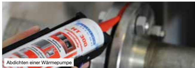
Abdichten einer Wärmepumpe

Elastische Kleb- und Dichtstoffe werden heute in vielen Bereichen der industriellen Fertigung und Montage verwendet. Sie kombinieren die Vorteile der Kleb- und Dichttechnologie und werden überall dort eingesetzt, wo hohe Anforderungen an die Elastizität und Dichtwirkung einer Fügeverbindung gestellt werden.