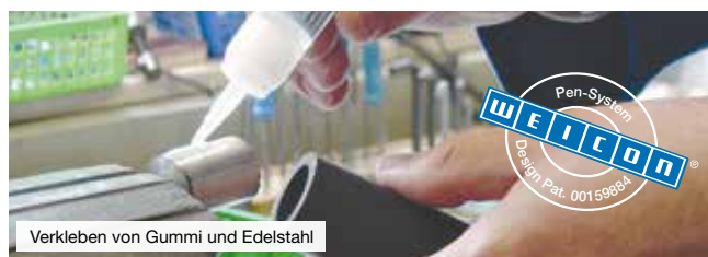
Verkleben von Gummi und Edelstahl