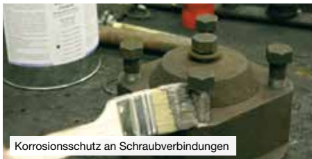
Korrosionsschutz an Schraubverbindungen

Wirksamer Schutz gegen Korrosion, Festfressen und Verschleiß, Oxidation und Passungsrost und elektrolytische Reaktionen („Kaltverschweißen“).