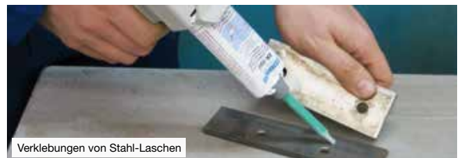
Verklebungen von Stahl-Laschen