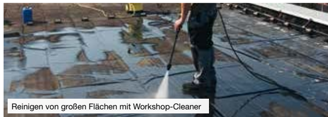
Reinigen von großen Flächen mit Workshop-Cleaner

Sie dienen der Pflege und dem Schutz von Oberflächen, zum Reinigen und Entfetten, Schmieren, Lösen und Trennen und sind unverzichtbarer Bestandteil der täglichen Arbeit.