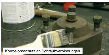
Korrosionsschutz an Schraubverbindungen

Wirksamer Schutz gegen Korrosion, Festfressen und Verschleiß, Oxidation und Passungsrost und elektrolytische Reaktionen („Kaltverschweißen“).