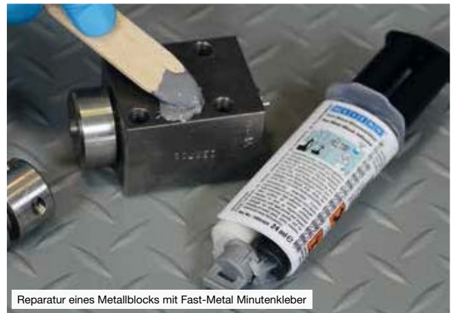
Reparatur eines Metallblocks mit Fast-Metal Minutenkleber