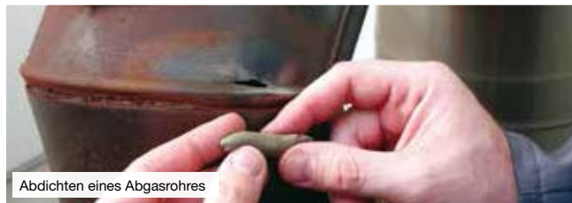
Abdichten eines Abgasrohres