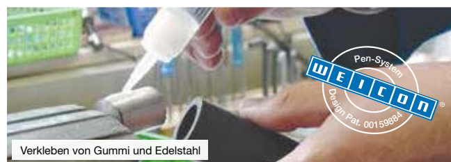
Verkleben von Gummi und Edelstahl