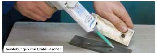
Verklebungen von Stahl-Laschen