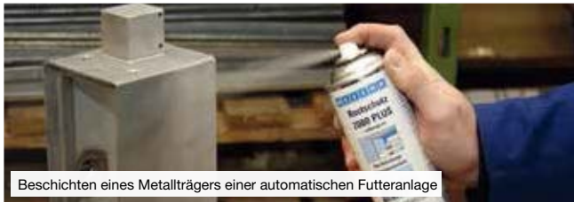
Beschichten eines Metallträgers einer automatischen Futteranlage