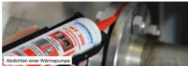
Abdichten einer Wärmepumpe

Elastische Kleb- und Dichtstoffe werden heute in vielen Bereichen der industriellen Fertigung und Montage verwendet. Sie kombinieren die Vorteile der Kleb- und Dichttechnologie und werden überall dort eingesetzt, wo hohe Anforderungen an die Elastizität und Dichtwirkung einer Fügeverbindung gestellt werden.