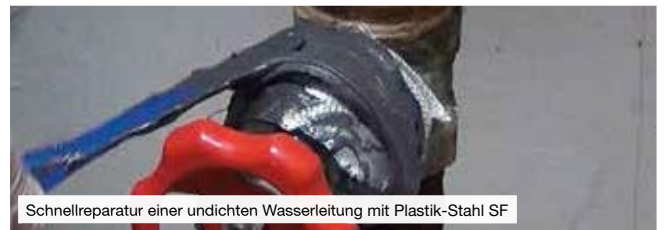
Schnellreparatur einer undichten Wasserleitung mit Plastik-Stahl SF