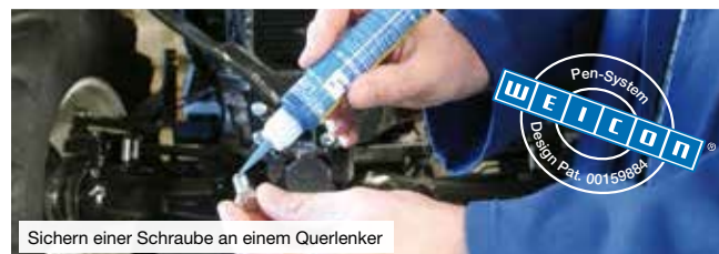
Sichern einer Schraube an einem Querlenker

Nach der Aushärtung entsteht eine vibrations- und stoßfeste Klebverbindung, die beständig gegen Chemikalien, Lösungsmittel und Temperaturen von -60°C bis +150°C ist.