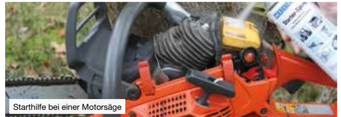
Starthilfe bei einer Motorsäge