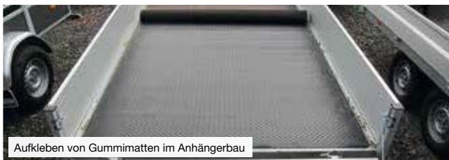
Aufkleben von Gummimatten im Anhängerbau

GMK 2410 ist ein Klebstoff auf Basis von Polychloropren (CR) mit einer hohen Anfangshaftung zur vollflächigen und flexiblen Verklebung von: